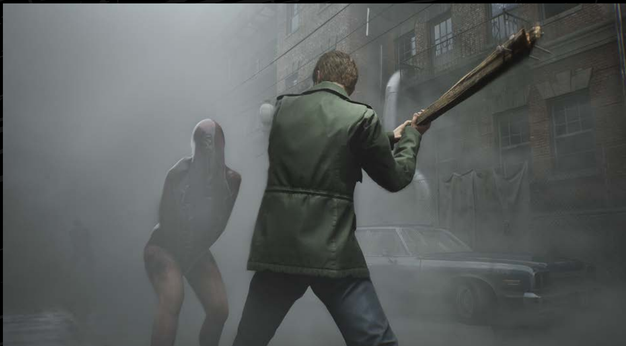
Silent Hill 2