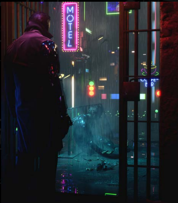
Observer: System Redux