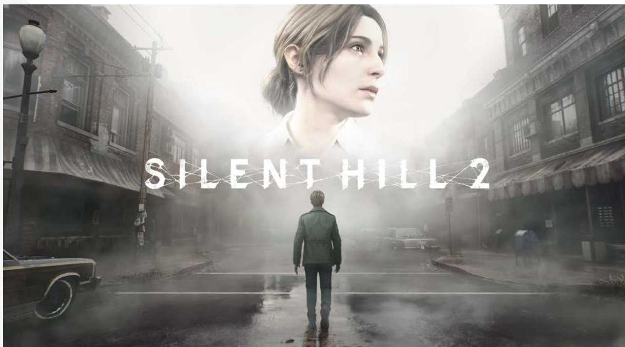
Silent Hill 2

W ubiegłym roku jednym z najważniejszych wydarzeń dla spółki była pierwsza zapowiedź realizowanej przez nas we współpracy z Konami gry Silent Hill 2. To jedna z najbardziej rozpoznawalnych marek w świecie gier, a zdecydowanie najbardziej istotna jeśli chodzi o gatunek horror. Opracowując długoterminową strategię osiągnięcia pozycji lidera w tym gatunku chcieliśmy na początku tych działań "dotknąć" IP, które jest jego kwintesencją. Nie sądziliśmy jednak w najśmielszych snach, że będziemy mieć zaszczyt tworzenia nowej wersji gry, która dla wielu z nas w Bloober Team stała się powodem do wejścia do branży gier.