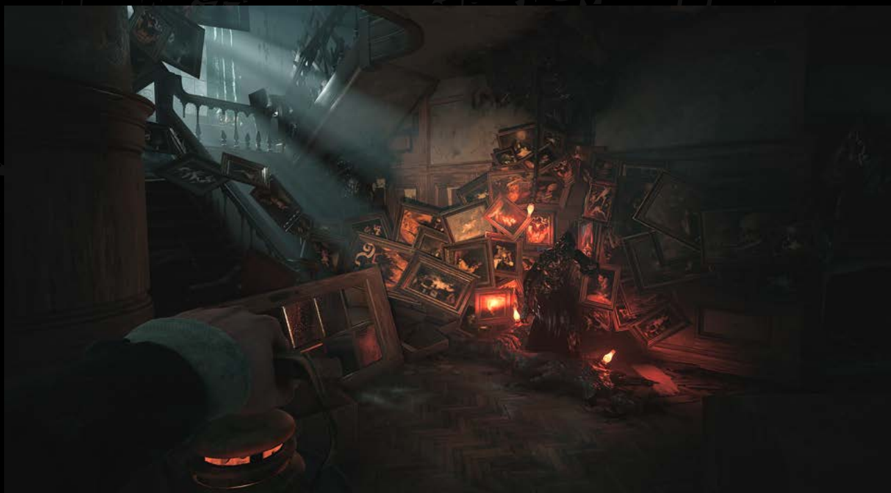
Layers of Fear